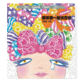
《跟笨蛋一起谈恋爱》 作者：朱德庸 出版社：北京联合出版公司

作者耗时4年，深入医院精神科、公安部等诸多机构，得以和数百名“非常态人类”直接接触，最终产生了一本——国内第一本精神病人访谈手记，有关人体、心理学、哲学、生物学、佛学、宗教、符号学、玛雅文明及预言的震撼探讨。