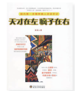
《天才在左 疯子在右》 作者：高铭 出版社：武汉大学出版社

卡拉，十八岁从父母家出走，如今又打算逃脱丈夫和婚姻；朱丽叶，放弃学生生涯，毅然投奔在火车上偶遇的乡间男子；佩内洛普，从小与母亲相依为命，某一天忽然消失得再无踪影……逃离，或许是旧的结束，或许是新的开始。一次次逃离的闪念，就是这样无法预知，或许你早已被它们悄然逆转，或许你早已将它们轻轻遗忘。