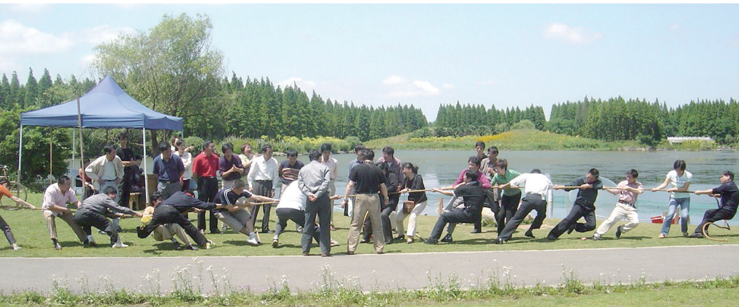
公司党员在崇明森林公园开展拔河比赛