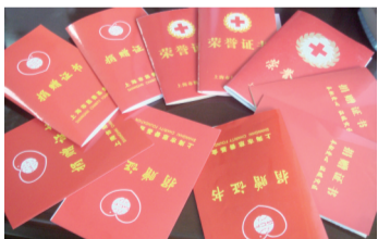
公司向区慈善基金会捐款部分证书

2008年起,公司每年召开职工代表大会,审议和通过《公司集体合同》和《工资集体协商协议书》,《公司集体合同》和《工资集体协商协议书》均由企业方和工会方多次协商,在广泛征求职工代表的意见后形成和完善。公司还将高温季节向员工发放高温季节津贴纳入《集体合同》,同时加强落实员工年休假制度。公司加强对劳动安全的检查工作,增强安全工作无小事