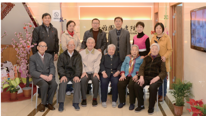
公司党员志愿者与舒雅园敬老院老人结对帮扶