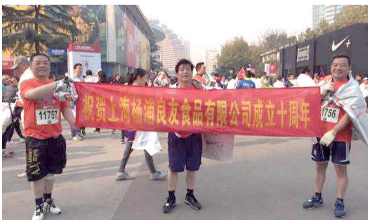
公司董事长(中)参加2013上海国际马拉松活动,庆祝公司成立十周年

十年风雨兼程,展望未来,传承和担当是公司的责任,公司将继续倡导“以人为本”的企业文化,团结和带领全体员工,为构建和谐企业、和谐社会、共圆中国梦奉献爱心和责任。以十年的坚持与不悔,十年的诚挚与热情,十年的奉献与努力,再创美好明天。