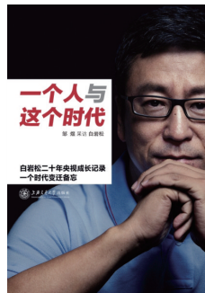
《一个人与这个时代》 作者:白岩松 出版社:上海交通大学出版社

长篇历史小说《汉血》讲述的是汉武帝晚年的巫蛊之祸,不仅让这个年轻时雄才大略的君主对自己的妻儿孙、文臣武将大肆杀戮,更直接导致了西汉王朝汉武帝时期最后一次大规模讨伐匈奴的失败,致十万汉军将士埋骨大漠的惨痛历史片段。全书共计十五万字,由上篇《巫蛊之祸》,下篇《血色汉关》构成。