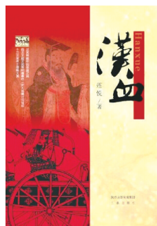
《汉血》 作者:莲悦 出版社:三秦出版社

长篇历史小说《汉血》讲述的是汉武帝晚年的巫蛊之祸,不仅让这个年轻时雄才大略的君主对自己的妻儿孙、文臣武将大肆杀戮,更直接导致了西汉王朝汉武帝时期最后一次大规模讨伐匈奴的失败,致十万汉军将士埋骨大漠的惨痛历史片段。全书共计十五万字,由上篇《巫蛊之祸》,下篇《血色汉关》构成。