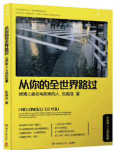
《从你的全世界路过》 作者:张嘉佳 出版社:湖南文艺出版社

作为中国电视新闻变革的亲历者,集记者、主持人、制片人和新闻评论员于一身的白岩松与这个时代紧密地联系在一起,本书是白岩松的20年央视成长记录,通过白岩松讲述这20年里他所亲历的故事、他所关注的新闻和人,来打量、记录他,更重要的是,记录这个变革的时代。