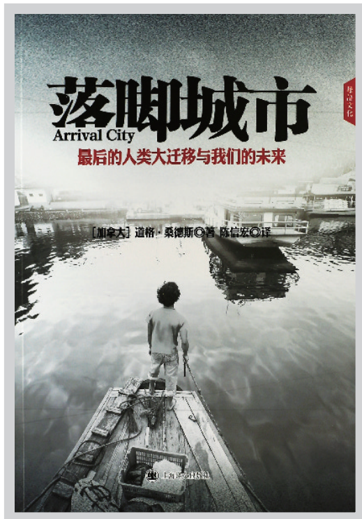
《落脚城市》 道格·桑德斯 上海译文出版社

记者出身的作家道格·桑德斯独到而敏锐地将目光聚焦于21世纪人口大迁移现象——“从乡村到城市,全球三分之一的人口正在进行最后