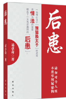
《后患》 作者:易卓奇 出版社:新华出版社