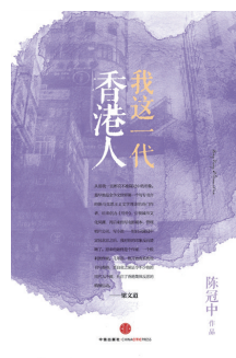
《我这一代香港人》 作者:陈冠中 出版社:中信出版社

上个世纪的中国,历经一波波战火的蹂躏与政治的动荡,许多华人被迫远渡重洋,在异乡找寻避风港。作者特别远赴美东,走访十二位海外名家,倾听他们畅谈人生与创作生涯,并藉由他们的亲身经历,评点过往的风云人物、雅事趣谈,细数一页页风卷残云的往事。