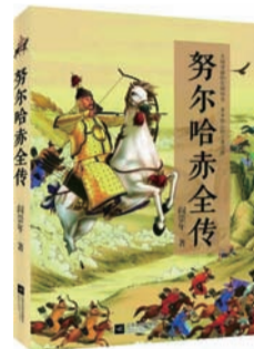
《努尔哈赤全传》 作者: 阎崇年 出版社: 江苏文艺出版社