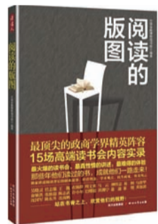
《阅读的版图》 作者: 中国金融博物馆书院 出版社: 四川文艺出版社