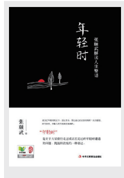
《年轻时》 作者：张颐武 出版社：中华工商联合出版社

本书是作者对人生警句的解读和阐释，这些文字多数有一个固定的程式，就是常以“年轻时”开头，以“古语说”引一句古语结束，作者解释说书名“年轻时”是对于大家曾经走过或正在走过的年轻时遭遇的问题、挑战和欣悦的一种表达。