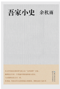
《吾家小史》 作者：余秋雨 出版社：长江文艺出版社

本书是三中全会之后，中国最具话语权的经济学家、精英学者集体建言书，囊括厉以宁、吴敬琏、林毅夫、周其仁、张维迎、郑永年……高层智囊把脉当下时局，聚焦改革热点，剖析改革路线，深入破解中国改革的密码与路线图，解读中国民众当下最关注的改革热点话题。