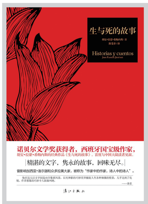
《生与死的故事》 希梅内斯 漓江出版社

他在《有声的孤独》中开始探索自己的诗歌道路，将传统的格律与现代诗歌的创作理念相结合，吟诵出了自己对故乡和祖国的爱；他在《小银和我》中深情地怀念自己的朋友小银——一只小毛驴，并用饱蘸着深情的笔触回忆了那一段有小银相伴的美好时光；《悲哀的咏叹调》一书充满着浪漫主义的风采，使他的作品成为了诗歌艺术的最佳典范，他本人也被誉为“诗人中的诗人”；《希望与渴望的上帝》是他一生探索的结晶，他认为上帝是诗、是爱、是永恒的人性。他