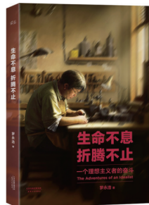
《生命不息,折腾不止》 作者:罗永浩 出版社:天津人民出版社

本书全新收录作者2009—2014年的“人生奋斗”经历,完整展现了一个理想主义者所经历的世界。他的奋斗不在于名声上的崛起,而在于对自己人格上的完善,对美好世界执着的追求。这个爱折腾的、人格闪亮的胖子,在演讲中把自己剖析得无比透彻,读者可以感受到他满满的诚恳和热情。