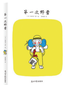
《第一次野营》 作者:林明子 出版社:光明日报出版社

本书全新收录作者2009—2014年的“人生奋斗”经历,完整展现了一个理想主义者所经历的世界。他的奋斗不在于名声上的崛起,而在于对自己人格上的完善,对美好世界执着的追求。这个爱折腾的、人格闪亮的胖子,在演讲中把自己剖析得无比透彻,读者可以感受到他满满的诚恳和热情。