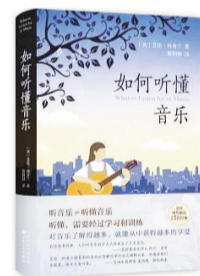
《如何听懂音乐》 作者:艾伦·科普兰 出版社:百花文艺出版社