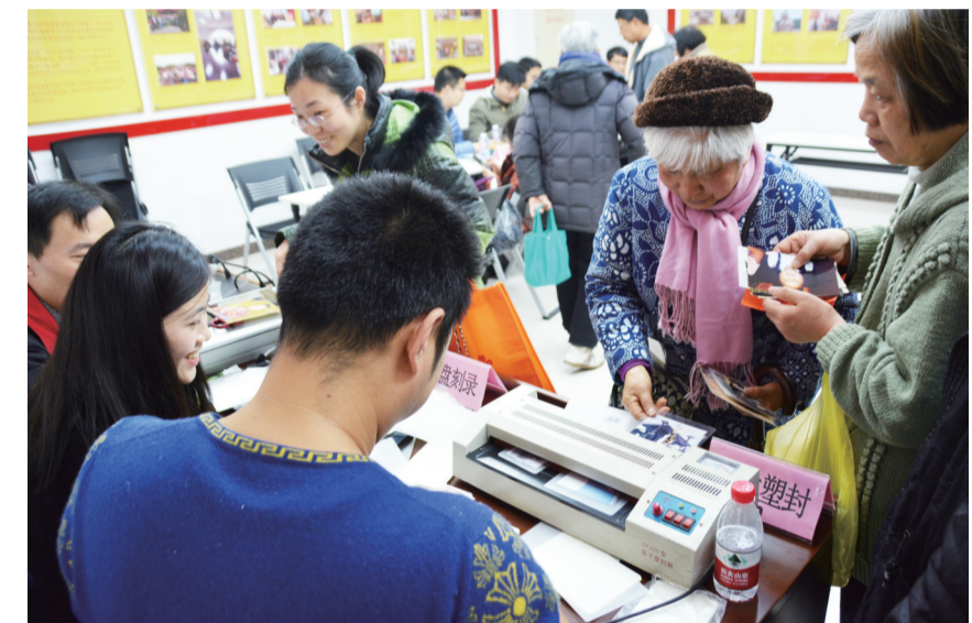
3月5日,四平路街道社区党建服务中心内,志愿者们为居民提供节水宣传、照片扫描、磨刀、理发等服务。