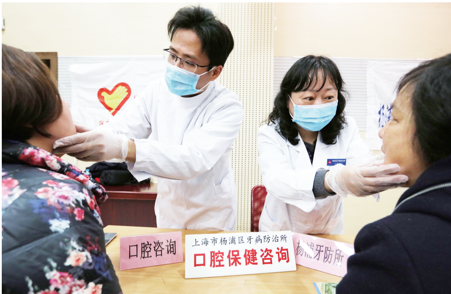
3月5日,大桥街道社区文化活动中举办的学雷锋主题活动现场,来自杨浦区牙病防治所的医生开展了口腔保健咨询和义诊,前来咨询的居民络绎不绝。