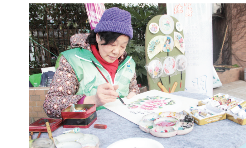
3月3日,控江路社区精品文化团队“同乐艺社”的学雷锋服务点格外引人注目,志愿者们根据居民需求现场题字作画。居民拿到心仪的作品后,还高兴地与志愿者合影留念。