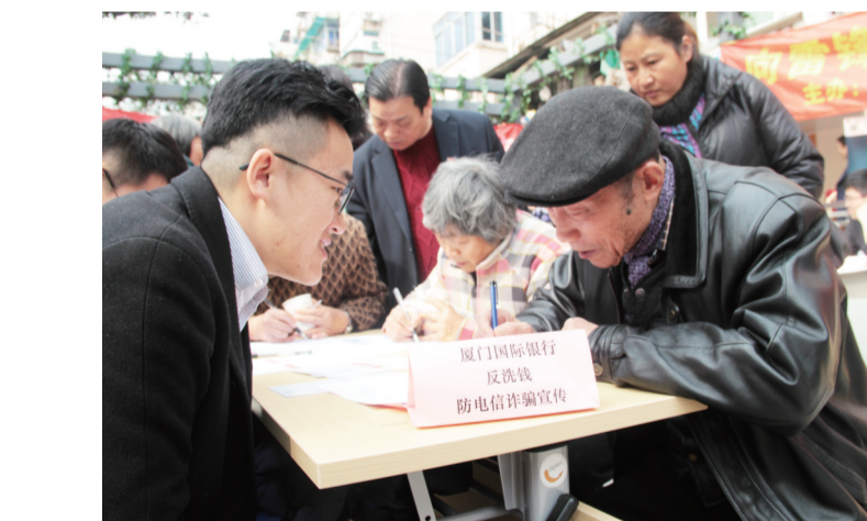
3月1日,在五场镇为老服务中心举行的学雷锋活动中,厦门国际银行的志愿者开展反洗钱防电信诈骗宣传,深受居民欢迎。