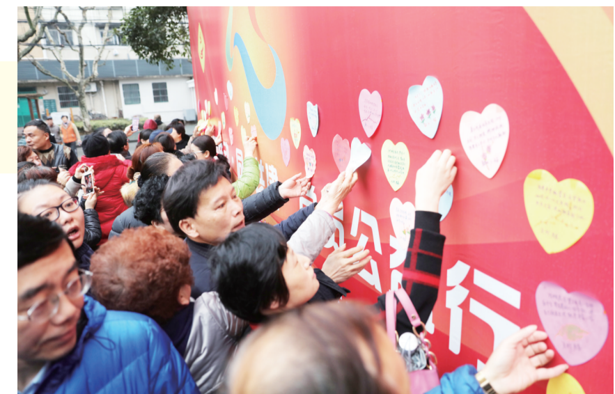
3月5日,四平路街道的心愿认领墙前,42个心愿不到半小时就被区域化党建联盟单位、社区老党员、在职党员和爱心人士认领一空。