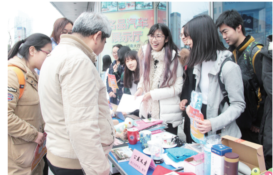
3月5日,五角场街道的“雷锋市集”开市,在“公益义卖”板块中,来自复旦大学等高校的志愿者鼎力吆喝,义卖所得将全部捐赠给街道的公益组织。