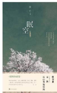
《眼空》 作者: 庆山 出版社: 人民文学出版社

《眼空》记录了作者创作长篇小说《春宴》前后一年的时序更替里,自己的写作、行走、思考、情感及情绪。远行、写作、阅读、严苛的内心训练,《眼空》追求文字的纯美,并做到了真实、诚恳的记录。