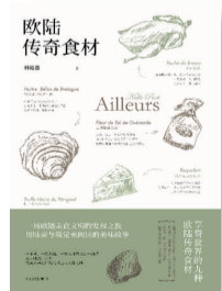
《欧陆传奇食材》 作者: 林裕森 出版社: 中信出版集团

《长生》讲述了2029年,遗传学家古德在偶然中发现了一种能延缓衰老的神奇物质——“上帝分子”。这种物质可以让人类的寿命延长至200岁,消息一出世界为之疯狂。随着消息的曝光长生所面临的问题也接踵而来,一些冷静者开始思考,人类的长生可能存在的资源枯竭、阶级固化、人权平等一系列问题。