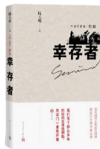
《幸存者》 作者:陆天明 出版社:人民文学出版社

《幸存者》讲述了谢平、向少文、李爽等一批共和国同龄人的奋斗史,描绘了他们曾经的风雨激荡,探寻这一代人精神的深度和广度。