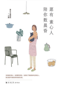
《愿有素心人,陪你数晨昏》 作者:青年文摘编辑部 出版社:中国青年出版社