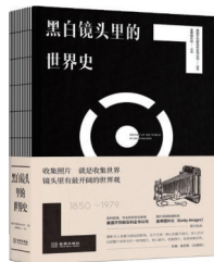
《黑白镜头里的世界史》 作者:美国不列颠百科全书公司 出版社:金城出版社

《完美策划》通过描绘一个策划大师的荒唐人生,反思今天我们身处的全民娱乐时代的人心与欲望。小说里的主人公秦朗,是个看上去吊儿郎当,但又不失理想主义的策划大师。全书故事有两条线索:一条是关于策划大师如何一步一步地把一个草根女孩炒成超级网红,最后这位超级网红欲望膨胀,毁灭;一条是策划大师良心发现之后的救赎之路。