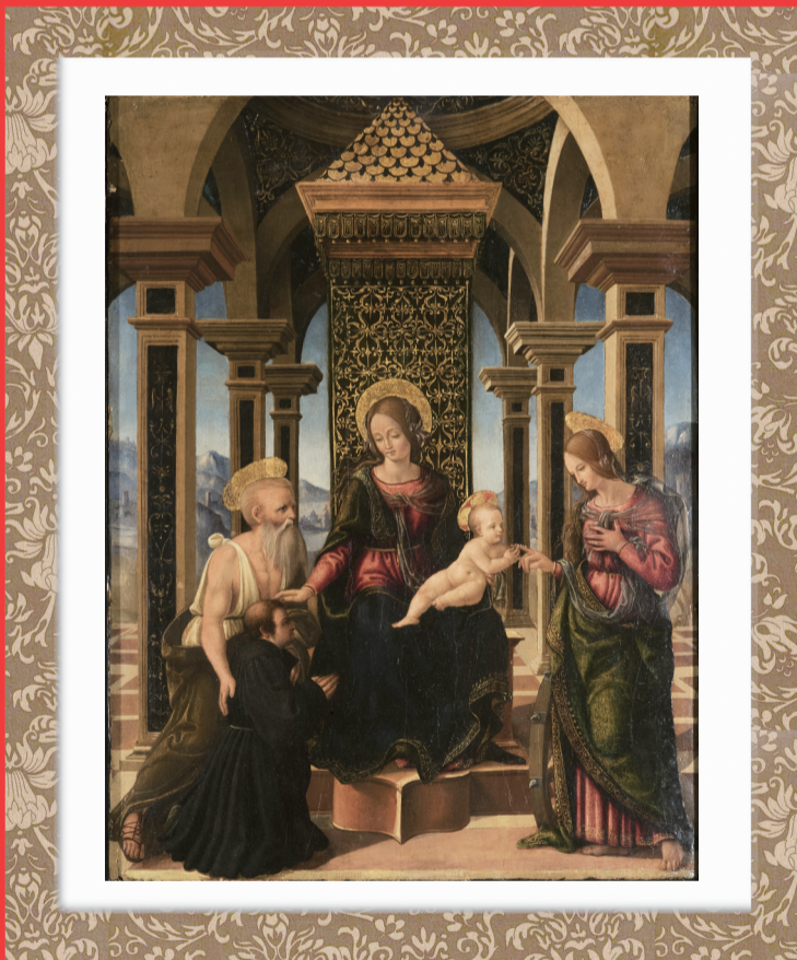
《圣凯瑟琳的神秘婚礼》,拉斐尔