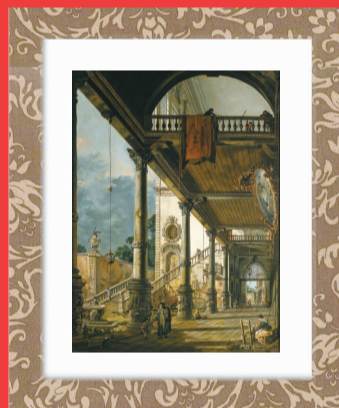
《随想:威尼斯大拱廊》,卡纳莱托