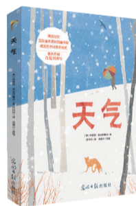
《天气》 作者:布丽塔·泰肯特鲁普 出版社:光明日报出版社

蜂蜜不需要在冰箱里储存;用热水洗碗起不到任何消毒效果;流行一时的撞树锻炼对身体没有好处……《健康日历 2018》是一本致力于给你更健康的生活指示的日历,专注为你科普那些与生活息息相关的冷知识。