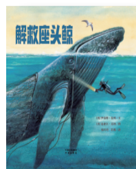
《解救座头鲸》 作者:罗伯特·伯利 温德尔·迈纳 出版社:中国对外翻译出版公司

本书以阳光、雨、雪、恶劣天气这四种常见的天气现象为主线,将天气现象、自然原理、人类活动有机地串联起来,用科学原理去分析,用趣味的语言来讲述,将万千气象知识娓娓道来,再配以唯美真实的风景插图,将科普性、趣味性与艺术性完美地融为一体。