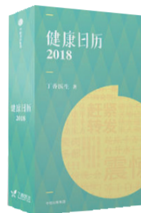
《健康日历 2018》 作者:丁香医生 出版社:中信出版社

蜂蜜不需要在冰箱里储存;用热水洗碗起不到任何消毒效果;流行一时的撞树锻炼对身体没有好处……《健康日历 2018》是一本致力于给你更健康的生活指示的日历,专注为你科普那些与生活息息相关的冷知识。