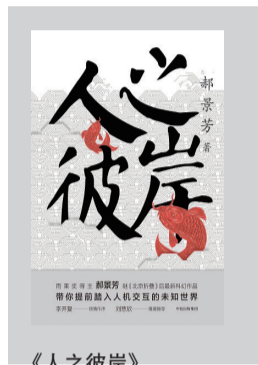
《人之彼岸》 作者:郝景芳 出版社:中信出版社

《人之彼岸》不仅包括作者最新创作的六篇中短篇小说,还包括两篇解读人工智能的文章,故事围绕人与人工智能的纠葛展开,其设定的场景既包括离我们很近的人工智能产品,也包括预设的地球被万神殿操控的宏大场面。