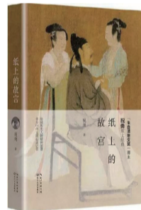
《纸上的故宫》 作者:祝勇 出版社:长江文艺出版社

《人之彼岸》不仅包括作者最新创作的六篇中短篇小说,还包括两篇解读人工智能的文章,故事围绕人与人工智能的纠葛展开,其设定的场景既包括离我们很近的人工智能产品,也包括预设的地球被万神殿操控的宏大场面。