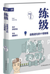
《练级:自我进化的十项修炼》 作者:菜刀少爷 出版社:中国友谊出版公司