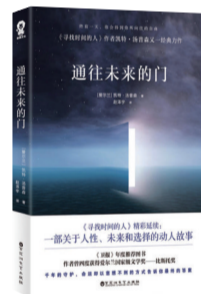
《通往未来的门》 作者:凯特·汤普森 出版社:百花洲文艺出版社