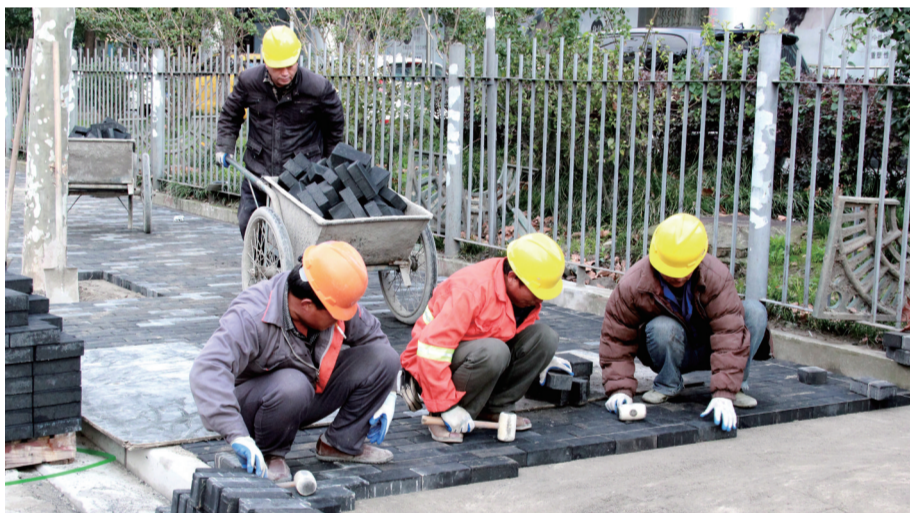
佳木斯路(营口路-沙岗路)道路积水改善工程的竣工,提升了区域防汛排涝能力。

10项新开工项目已启动前期工作:滨江技博会配套路网工程正编制项目建议书,临青路(河间路-平凉路)交通改善工程、双阳路(控江路-周家嘴路)交通改善工程正结合架空线入地方案进行深化,沙岭路(顺平路-周家嘴路)道路新建工程、顺平路(隆昌路-沙岭路)道路新建工程启动前期手续办理,大武川雨水泵站截流调蓄工程完成初步设计上报,仁德变电站规划方案已获批,供水管网改造工程、市政污水管网完善工程正编制实施方案,扶苏路道路改建工程施工许可证正在等待批复。