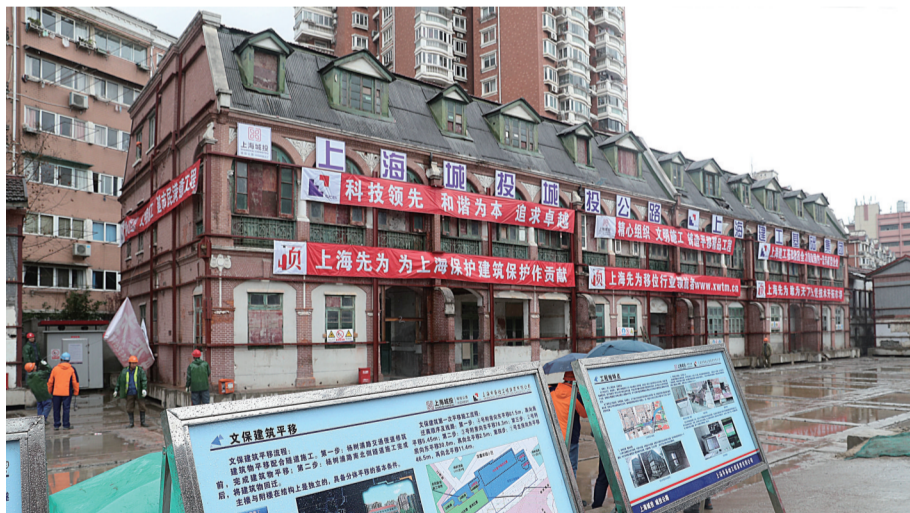
为配合江浦路隧道结构施工、杨树浦路综合改造等工程,这座拥有116年历史的文物建筑实施平移,待工程完工后回迁至原址。