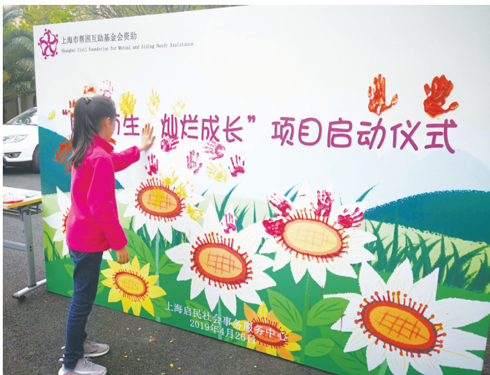
图为参与活动儿童在签名墙上按下手印,组成一幅美丽的向日葵手印画。

本报讯日前,一场以关爱困境儿童为主题的“向阳而生,灿烂成长”项目启动仪式在殷行街道社区党建服务中心举行。