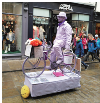
也许演唱艺人的状况要好些。街

欧洲的街头艺人似乎很常见。比如活人装扮的“雕像”，一动不动做某个姿势站那儿，还要浑身洒上金粉或是别的什么粉，等人施舍几个钢镚，这钱挣得真是不易。可是那些演员好像并不以此为苦，每天按时“上班”，没有人注意他，也不着急。遇到有爱心的小朋友前来投币，“活雕塑”会感动得弯下腰来与孩子作一番简单互动，借此松松筋骨。而多数时候，路人几乎不会去理会他们的存在——司空见惯了么！我不知道支撑他们坚持的动力是什么，因为单纯从经济考虑，他们的表演是挣不了几个钱的。那么，就只能说是对艺术的执着追求了。