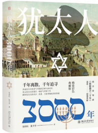
《犹太人3000年》 作者:张倩红 张少华 出版社:北京大学出版社

《孤独的大师》是一本以西方艺术大师为主角的随笔集,书中呈现了一幅浩繁的大师谱系,作者将眼光瞄准西方艺术史上那些灿烂的星辰,笼括了达·芬奇、丢勒、米开朗基罗、拉斐尔等13位画坛名擘。这些画家或同处一个时代,群星掩映;或相距三四百年,遥相呼应。