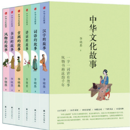
《中华文化故事》丛书 李晓愚 译林出版社