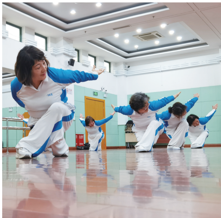
一招一式，慢而雅致……四平路木兰拳队的日常训练可谓“赏心悦目”。日前，这支队伍荣获市级奖项，是社区里的“明星”。

早在2010年，为加强体育工作网络建设，四平路街道在23个居民区分别成立了社会体育指导员小组，从太极拳、广场舞，到健身操、国际象棋，引导居民科学健身。自2013年起，街道不断探索“家庭健身指导员”模式，从体育指导员中招募了百余名优秀指导员作为家庭健身指导员，开展上岗培训，制定工作流程。对于各个居民区里的健身小队，街道也积极提供人员、场地等方面的帮助，进一步推动社区体育发展。