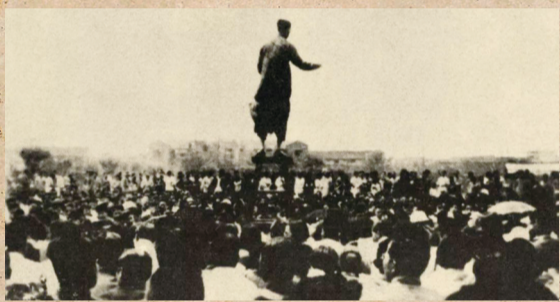
1936年,刘尧模在上海西门公共体育场指挥数千群众高唱《义勇军进行曲》