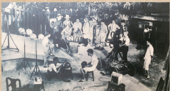
1935年1月20日,电通公司开拍《风云儿女》电影