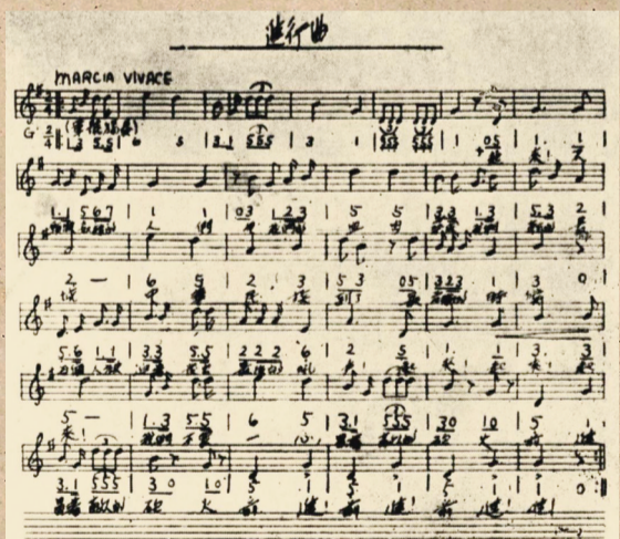
聂耳最后审音定稿的《义勇军进行曲》手稿