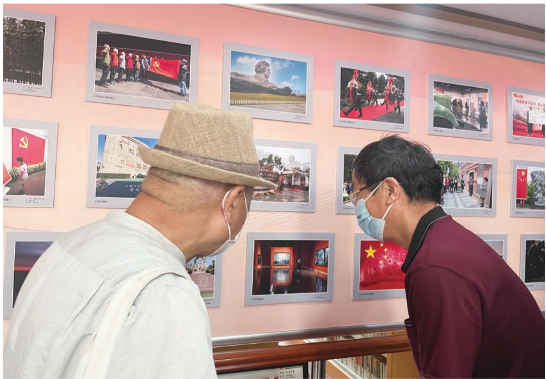
“在翰墨、丹青、快门中，收获心灵共振和艺术共享”……近日，“墨彩镜颂百年辉”——杨浦区老干部庆祝中国共产党成立100周年书画摄影展举行，共展出作品366幅。记者了解到，今年，区委老干部局开展了“盛赞百年辉煌、助力百年征程”主题活动：包括“同心颂党恩、助力新征程”全区老干部庆祝建党百年文艺演出、全市“从石库门再出发——学习党史国史、传承红色基因、争做时代新人”主题活动启动仪式暨寻访“红色印记”定向赛等。同时，组织全区离退休干部开展了“我看建党百年新成就”微论坛活动、“我为杨浦发展献一策”活动、党史知识竞赛、诗歌征集朗诵活动、网上摄影展以及与居民区党组织党建联建文艺演出等，为广大老干部提供了抒发爱党爱国热情、展示文艺风采的平台。 ■记者 成佳佳

情景剧《国泰民安》再现了各民主党派、无党派人士积极响应，共同协商建国的燃情岁月。最后，一曲《不忘初心》唱出了不忘来时路、砥砺新征程的时代心声。