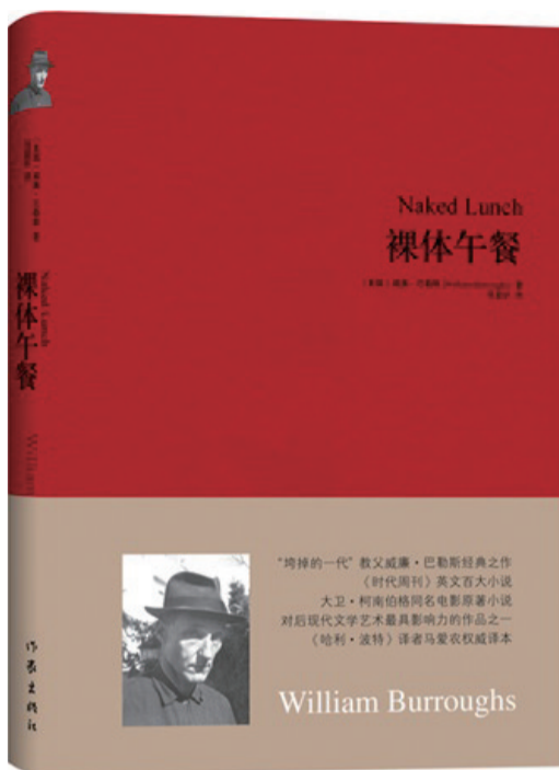
《裸体午餐》 威廉·巴勒斯 作家出版社