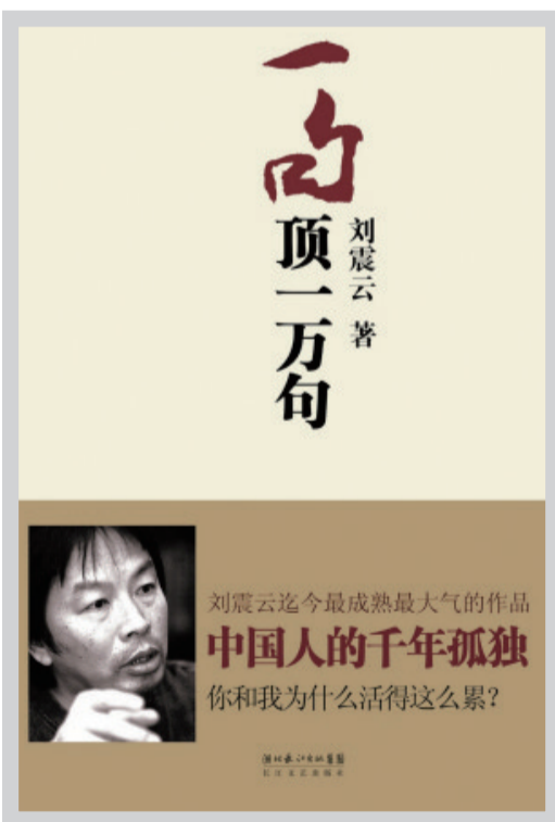
《一句顶一万句》 刘震云 长江文艺出版社

西的故事,最后却是听了罗安江的遗孀何玉芬说的一句话:“日子是过以后,不是过从前。”这或许是富有民间智慧的一句话,它针对牛爱国“寻根”的历史化举动给予了明确的否定。