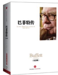
《巴菲特传》 作者:罗杰·洛温斯坦 出版社:中信出版社

本书是作者最新的长篇小说力作。喀拉布风暴是沙漠中的黑风暴,其实也是一场爱情风暴。作品通过对男主人公张子鱼、孟凯、武明生,女主人公叶海亚、李芸、陶亚玲,以及由他们所勾连的各个家族的描述,在西域大漠、边地塞外或繁华都市,演绎了一部极具震撼力和艺术表现力的人类生存史和生命史。