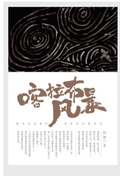
《喀拉布风暴》 作者:红柯 出版社:重庆出版社

本书是作者最新的长篇小说力作。喀拉布风暴是沙漠中的黑风暴,其实也是一场爱情风暴。作品通过对男主人公张子鱼、孟凯、武明生,女主人公叶海亚、李芸、陶亚玲,以及由他们所勾连的各个家族的描述,在西域大漠、边地塞外或繁华都市,演绎了一部极具震撼力和艺术表现力的人类生存史和生命史。