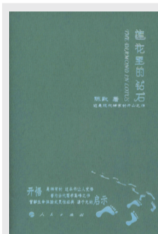
《莲花里的钻石》 作者:陈默 出版社:人民出版社

这是一套想象力丰富的绘本故事书,也是一套幽默风趣的儿童科普书。跟随蓝色乐团的五只小蓝鸟,小朋友们可以穿越美洲、巡游海岸、环游世界,体验惊险、刺激、有趣的观鸟之旅。