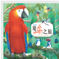
《蓝色乐团观鸟之旅》 作者:卡萝尔·L·马里诺 出版社:安徽少年儿童出版社

这是一套想象力丰富的绘本故事书,也是一套幽默风趣的儿童科普书。跟随蓝色乐团的五只小蓝鸟,小朋友们可以穿越美洲、巡游海岸、环游世界,体验惊险、刺激、有趣的观鸟之旅。