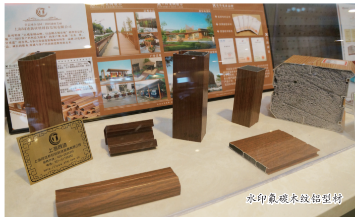
水印氟碳木纹铝型材