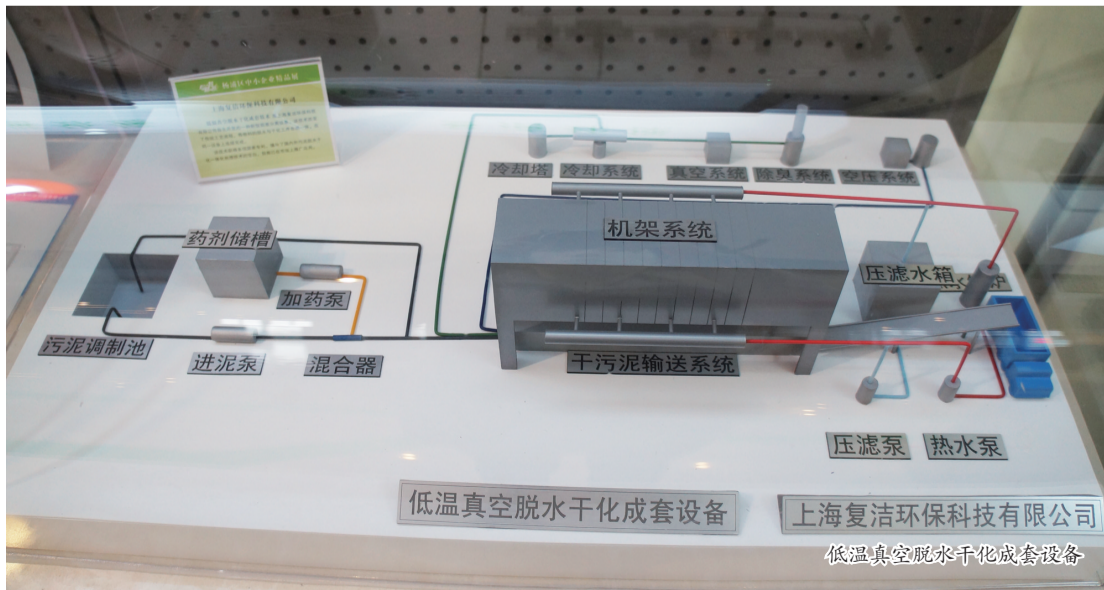
低温真空脱水干化成套设备