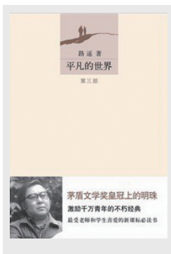
《平凡的世界》 作者：路遥 出版社：北京十月文艺出版社