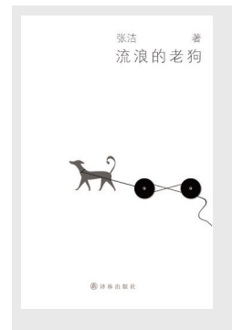
《流浪的老狗》 作者：张洁 出版社：译林出版社

作者爱旅行，爱流浪，甚至将自己比作流浪的老狗。她独自游走在世界各地的大街小巷，一路拍拍走走，用相机和文字记录了一个个让人心动的瞬间，随心而动，有感而发，为所有喜爱她的读者奉献了一场饕餮盛宴。