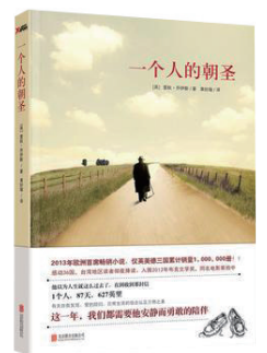
《一个人的朝圣》 作者：蕾秋·乔伊丝 出版社：北京联合出版社

作者爱旅行，爱流浪，甚至将自己比作流浪的老狗。她独自游走在世界各地的大街小巷，一路拍拍走走，用相机和文字记录了一个个让人心动的瞬间，随心而动，有感而发，为所有喜爱她的读者奉献了一场饕餮盛宴。