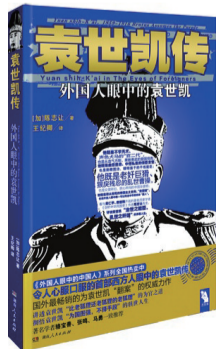
《袁世凯传》 作者:陈志让 出版社:湖南人民出版社