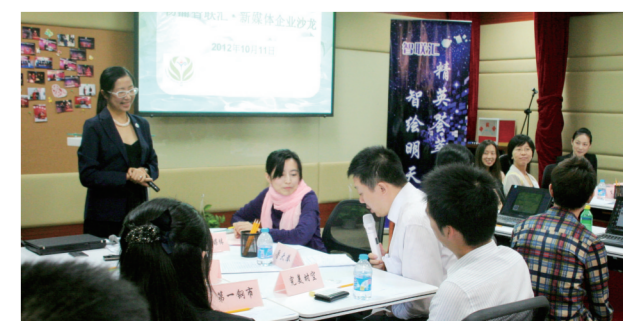
“智派之友”在新媒体企业HR专场沙龙上对话交流

展。重点聚焦新媒体企业,举办“智联汇”新媒体企业HR和CEO专场沙龙,邀请区域内网络媒体、移动媒体、数字电视媒体和新媒体科技公司等新媒体企业,对话交流,信息共享。