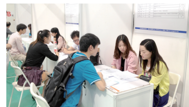
区工商联会员企业在民营企业招聘周活动现场接受求职者咨询

这一系列活动的开展,发挥了非公有制经济企业在扩大就业中的主渠道作用,增强了非公有制经济人士履行社会责任的光荣感;也为非公有制经济企业做强做大吸纳储备了优秀人才,实现了