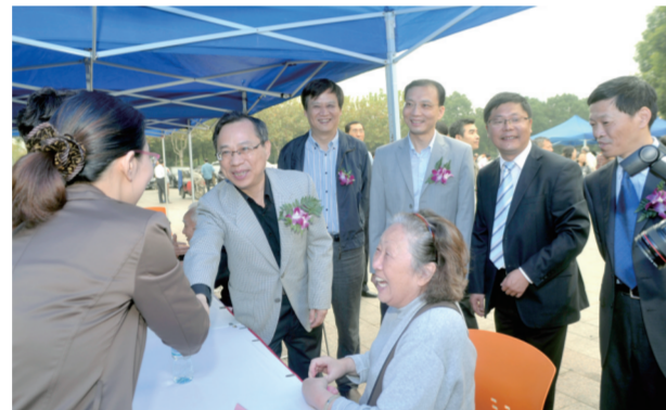
市、区领导参加民盟百名律师义务法律咨询活动

动计划”,软件的捐赠使用工作已经覆盖贵州、河南、山东、宁夏等省份。杨浦民盟智力支教的行动得到盟盟中央和上海市委的高度重视和充分肯定,《人民政协报》、《团结报》等媒体先后多次报道。