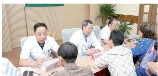
民进“同心”医疗志愿队成员为社区居民服务