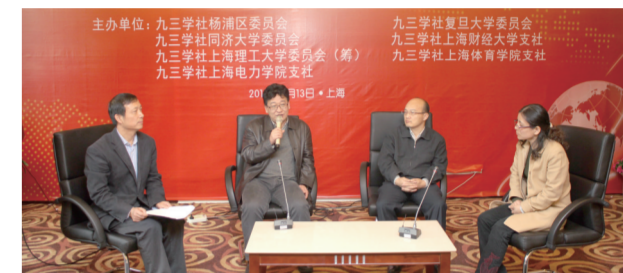
2013年“知识杨浦”九三论坛上专家学者为杨浦发展出谋划策

切实践行杨浦“三区融合、联动发展”的核心理念,凝聚区域内高校的专家学者,围绕杨浦经济社会发展中不同阶段的热点、焦点问题,建有用之言,献务实之策,为杨浦的经济稳步发展、社会和谐进步作出了贡献,体现了新一代党外人士的时代风采。