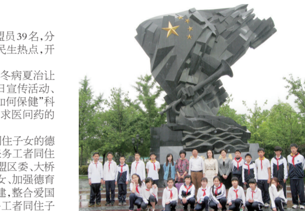
台盟杨浦区委的盟员与外来务工人员同住子女在国歌纪念馆前合影留念

关爱外来务工人员同住子女。台盟杨浦区委以加强外来务工人员同住子女的德育教育为抓手,与共建单位大桥街道(社区)党工委组织20余名外来务工人员同住子女参观国歌纪念馆和国歌展示馆,进一步激发爱国主义情怀。盟区委、大桥街道、国歌展示馆及市光学校联合举办了“关爱外来务工人员同住子女,加强德育教育”研讨会,共同探讨如何深化台盟与大桥街道等单位的合作共建,整合爱国主义教育基地、社区、学校等各方资源,通过多种形式加强对外来务工人员同住子女的德育教育,充分发挥民主党派的的社会服务功能,营造关爱外来务工人员同住子女的良好环境。