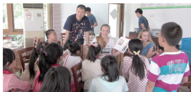
民建成员在英语夏令营中为山区孩子开展英语情景教学

自己的人身价值。为了办好夏令营,会员自发筹集善款14800元,还有的会员免费为营员提供食宿、礼品及车辆服务,邀请外籍人士参与英语施教,提升了夏令营成效,丰富了孩子们的收获。