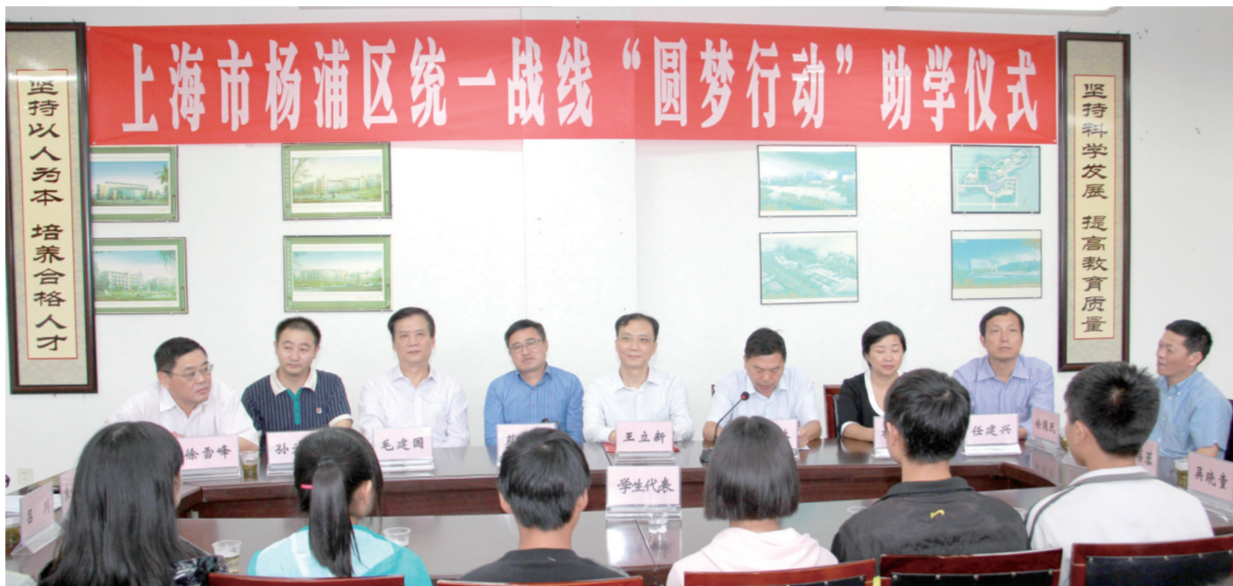
2013年10月,杨浦统一战线与遵义统一战线签署《杨浦、遵义统一战线“同心共圆中国梦”帮扶协议》,凝聚党派团体力量,帮助推进对口地区教育人才培养、智力渠道拓宽、医疗水平提高、贫困学生资助和经济建设发展,共同实现“同心”帮扶、共圆“中国梦”目标。