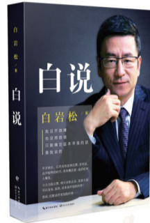
《白说》 作者:白岩松 出版社:长江文艺出版社

《白说》是央视资深新闻人白岩松继《幸福了吗》《痛并快乐着》之后的全新作品，一部“自传”式的心灵履历。通过近年来于各个场合与公众的深入交流，以平等自由的态度，分享其世界观和价值观。时间跨度长达十五年，涵盖时政、教育、改革、音乐、阅读、人生等多个领域。