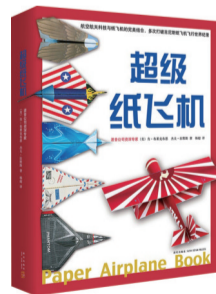
《超级纸飞机》 作者:肯·布莱克布恩 杰夫·拉默斯 出版社:新星出版社

今天的芸芸众生也仿佛是在茫茫人海中漂泊，在某一瞬间，彼此的光亮交汇，然后擦肩而过。很多真实的人物也像“所有我们看不见的光”那样在黑暗中追寻看不见的光，让我们相信，历史不只有无边无际的黑暗，人类的道路如同在狭窄的黑暗中摸索，前方仿佛若有光，初极狭，顽强复行走，必将豁然开朗，芳草鲜美，落英缤纷。（来源：新华读书）