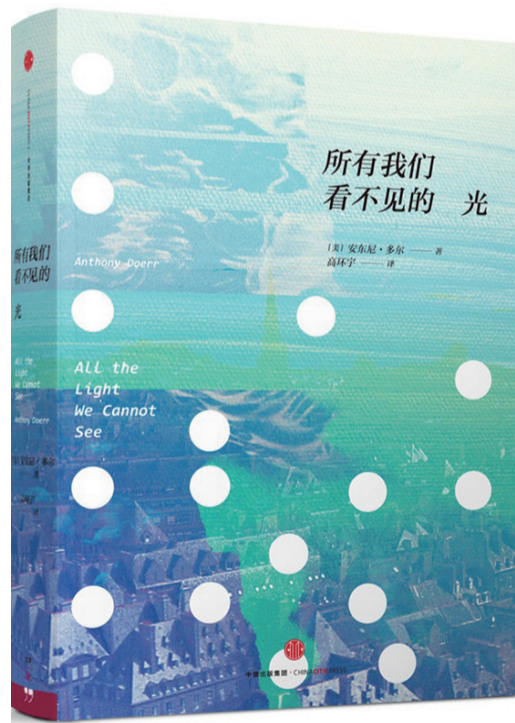
《所有我们看不见的光》 安东尼·多尔 中信出版社

《所有我们看不见的光》是一个写法上颇为考究的小说，首先，刻意限制视觉描写，女主人公玛格丽特双目失明，从头到尾，读者只能通过嗅觉、听觉、触觉和她的思维来感知大轰炸下的世界，获得不同于电影画面感的阅读体验。其次，片段式双线并