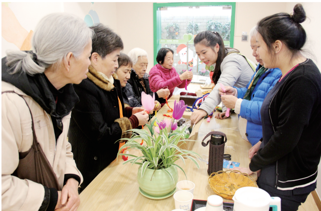
个小时的服务相比,长者照护之家的功能更丰富,提供的服务也更齐全,更重要的是,它就在社区里,方