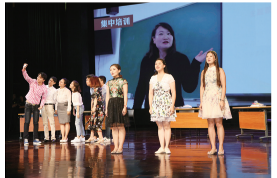
音乐剧《奋斗的青春最美丽》