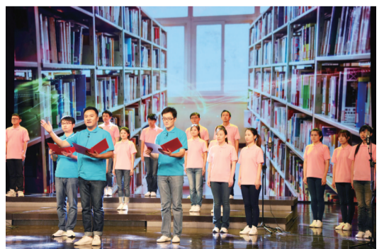
原创诗朗诵《我骄傲,我是杨浦教师》