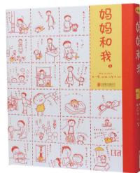
《妈妈和我》 作者:村松江梨子 中川碧 出版社:北京联合出版有限公司

五味杂陈的人生,有时需要一点时间的疗愈,又或者是,一块蛋糕;伤心时渴望得到温暖的抚慰,就像爸爸炖的鸡汤一样熨帖;来不及告别的人,在那份不能复刻的菜谱里,一遍遍说着再见……用心制作美食,制作这些独一无二的美食,是平凡日常里的小小仪式,用情感和故事赋予美食独特的意义,是姜老刀喜欢的记录生活的方式。