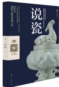
《说瓷》 作者:范冬青 出版社:上海人民美术出版社

本书是范冬青近年来从事中国古陶瓷研究与鉴定工作的心得手记。旁征博引,深入浅出,内容详实。从传世实物、历史文献、考古资料和窑址发掘四个方面帮助读者掌握古瓷的鉴定方法和基本知识。同时还大量应用了实物图片,通过对十三个代表性窑口风格和特征的讲解,帮助广大古瓷文化研究者、爱好者、收藏家能够更好地学习古瓷的品鉴和收藏。