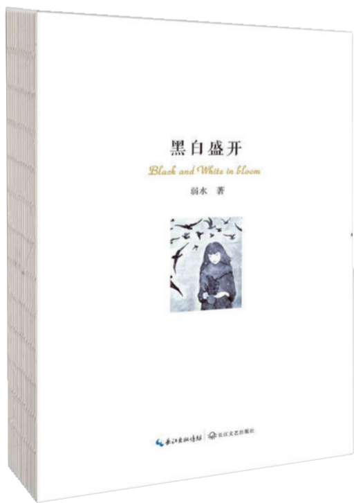
《黑白盛开》 弱水 长江文艺出版社

弱水的文字清新洗练,蕴含着一种自然而然的节奏感,宁静、理性、节制,在该静默的时候静默,该透明的时候透明。在《黑白盛开》一书的开篇《与我们的性别和谐相处》,可以说