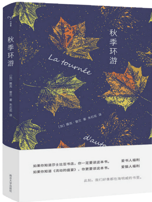
《秋季环游》 雅克·普兰 南京大学出版社

这个世界从来不可缺少爱书成癖的人,加拿大作家雅克·普兰就是一个。很多时候,书给了他创作的灵感,他也把书放在了第一位。《秋季环游》是这样一首献给书的情诗。普兰把他对图书的热情统统写入其中,并不带有丝毫的掩饰与伪装。虽然名为“秋季环游”,他的笔下却没有萧瑟的秋天。相反,字里行间流动着丝丝暖意。仿佛是在提醒我们,书籍的世界里永远没