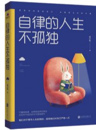
《自律的人生不孤独》 作者:初小軌 出版社:北京联合出版公司

二十四节气是中国人的发明,但其影响早已跨越国界,成为了东亚和东南亚各国人民共享的知识。有关二十四节气的诸多具体知识,或许只有特定地区或较少数量的人群有比较清晰的掌握,但这一知识系统却潜移默化地影响着几乎所有中国人的日常生活,也就是说,我们每个人都是二十四节气的传承人。就此而言,围绕二十四节气相关问题进行积极的调查、搜集、研究、出版和推广等工作,对于我们更加全面、深入地了解和认识这一作为自己传统重要有机组成部分的知识体系,更为有效地维护这一知识体系的传承和发展,都具有不可忽视的意义。而这一点,也正是《花开未觉岁月深:二十四节气七十二候花信风》这本书出版的价值所在。(来源:新华读书)