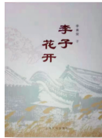
《李子开花》 作者:李素荣 出版社:上海文化出版社

《李子开花》一书时间跨度从1917年到2017年,通过雄安新区白洋淀畔李氏家族几代人跌宕起伏的风云历程,映射出了燕赵大地上人们的勤劳善良、守望土地的艰辛,以及追求美好生活的执着。全书描绘了白洋淀的风土人情以及燕赵大地的民间习俗,有着浓郁的地域特色和时代特征。