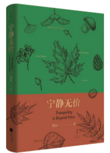
《宁静无价》 作者:程虹 出版社:上海人民出版社

作者讲述了十几位英美自然文学家如何与大自然相拥生活,如何从大自然中获得滋养,如何在自然中得到的感悟转化为精神的升华,通过大量的文本细读,生动呈现了地理环境、心灵启示和文学风格三者间的深入联系。