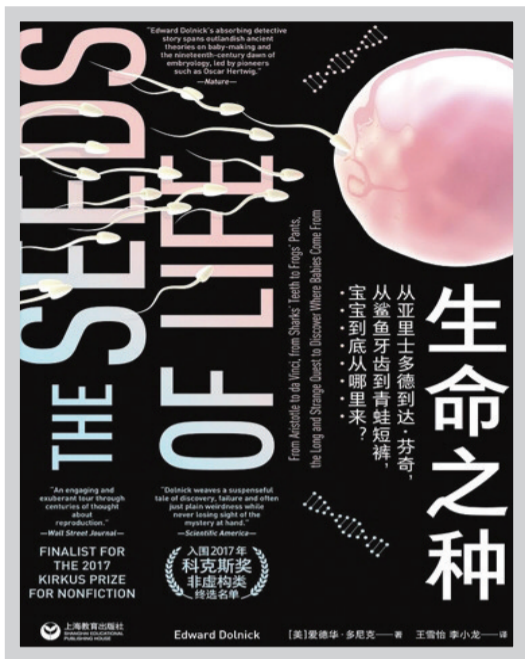
《生命之种》 爱德华·多尼克 上海教育出版社

“我从哪里来”也许是每个人都曾有过的疑问,回答这个问题并不容易,千百年来,这个问题一直困扰着人类,甚至让诸多绝顶聪明的人和伟大的学者,耗费了毕生精力而不得其解。