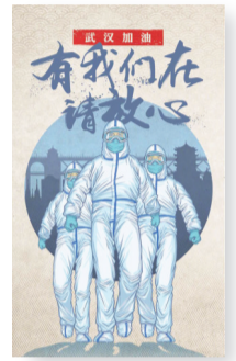
《最美逆行者》 作者:国家卫生健康委宣传司 出版社:人民出版社

该书通过一系列感人故事与描写,多个视频片段,为读者勾勒出了防控新冠肺炎疫情阻击战中医务工作者的英雄群像,其中既有钟南山、李兰娟等著名医学专家,也有诸多默默无闻的医护人员。全书生动展现了他们的初心使命、铁的担当与家国情怀,有助于我们进一步坚定信心、振奋精神、凝聚力量,坚决打赢疫情防控的人民战争。