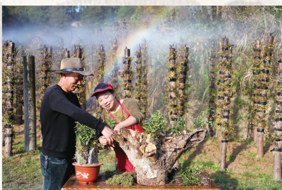
铁皮石斛养植除入药外,还被制成造型各异的小型盆栽。