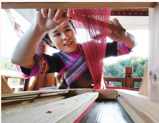
畲族彩带传统编织。