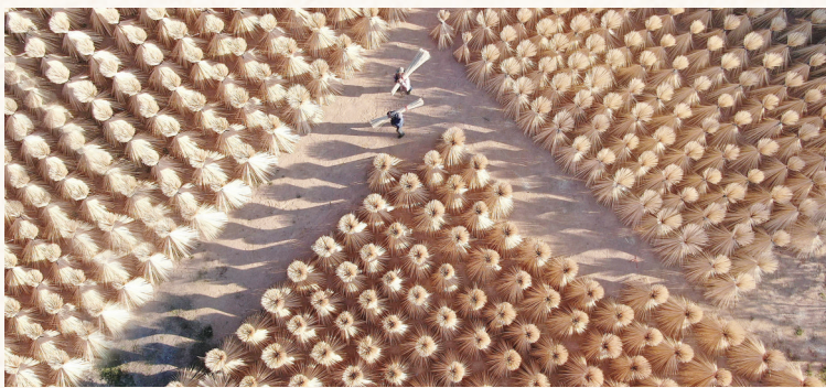
正在晾晒的竹签,将用于制作筷子、烤串签、工艺品等。