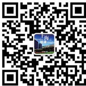
“上海杨浦”微信公众号