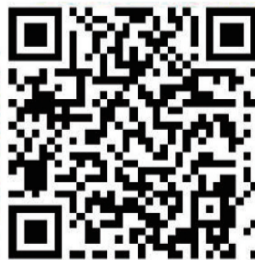
“上海杨浦”政务微博