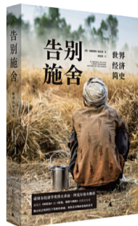
《告别施舍:世界经济简史》 作者:格里高利·克拉克 出版社:广西师范大学出版社

马尔萨斯陷阱、工业革命、大分流——人类告别施舍,摆脱残酷发展循环,重新选择贫富命运的前行之路。作者运用各个文明的经济史料,以人和文化的角度向我们解释制度与资源在社会中的合理角色,揭示文化在发展的关键作用。