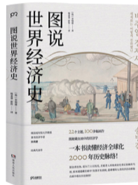
《图说世界经济史》 作者:宋炳辉 出版社:湖南人民出版社

马尔萨斯陷阱、工业革命、大分流——人类告别施舍,摆脱残酷发展循环,重新选择贫富命运的前行之路。作者运用各个文明的经济史料,以人和文化的角度向我们解释制度与资源在社会中的合理角色,揭示文化在发展的关键作用。