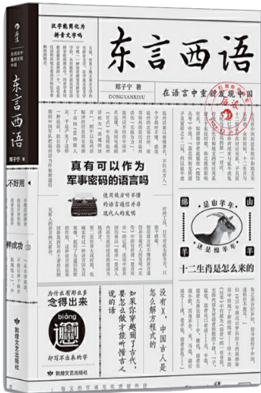
《东言西语:在语言中重新发现中国》 郑子宁 敦煌文艺出版社

日常语言影响着个体的思维方式,方言维系了民族的历史记忆,政治语言决定了国家的现实意识。然而,全球化浪潮下,今天语言消失的速度是前所未有的,从个人到国家,乃至所有民族,都有无尽的记忆与传统渐渐被我们忘却。但语言就如生物基因一样,储存着丰富的历史信息。