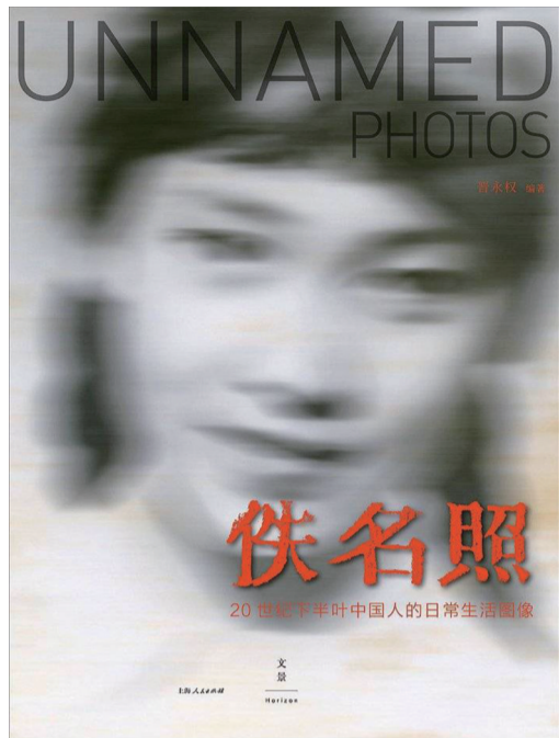
《佚名照》 晋永权 上海人民出版社

《佚名照：20世纪下半叶中国人的日常生活图像》(以下简称《佚名照》)不是再一次重构旧日世界，更不是对逝去的日常生活样貌借影像涂抹上一层温情而迷幻的色彩。而是通过佚落的日常生活照片，试图寻找出20世纪下半叶，中国人日常照相行为所建构起来的社会逻辑与历史逻辑。这些影像出人意料地呈现出这一时期中国人生活的表与里，现象与本质，既关乎过往，也预示未来，其中隐含着中国人现代精神成长史中的重要环节。