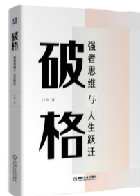
《破格：强者思维与人生跃迁》 作者：白格 出版社：机械工业出版社

如今，伴随互联网、人工智能、深度学习的发展，软件正在吞噬整个世界，作者认为，要想摆脱技术海啸带来的焦虑和威胁，需要的既不是长期愿景，也不是保守防御，而是一种能够创造激荡人生的进攻性战略，追求卓越的本质意味着不可替代的专业知识与无与伦比的个人魅力，他将自己多年来对各类企业和企业家案例的分析研究总结为《追求卓越的本质》一书，为每一个身处技术海啸中的企业与个人提供指导原则和应对路线图。