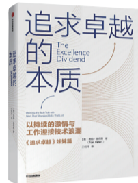
《追求卓越的本质》 作者：汤姆·彼得斯 出版社：中信出版社

如今，伴随互联网、人工智能、深度学习的发展，软件正在吞噬整个世界，作者认为，要想摆脱技术海啸带来的焦虑和威胁，需要的既不是长期愿景，也不是保守防御，而是一种能够创造激荡人生的进攻性战略，追求卓越的本质意味着不可替代的专业知识与无与伦比的个人魅力，他将自己多年来对各类企业和企业家案例的分析研究总结为《追求卓越的本质》一书，为每一个身处技术海啸中的企业与个人提供指导原则和应对路线图。