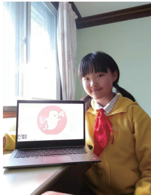
如何平稳度过居家学习生活的这段时间?连日来,杨浦各个学校和社区积极行动。

各年级的学生用一句话、一幅画、一封信、一个小制作、一个小视频、一个善举,向最美逆行者表达感激之情。