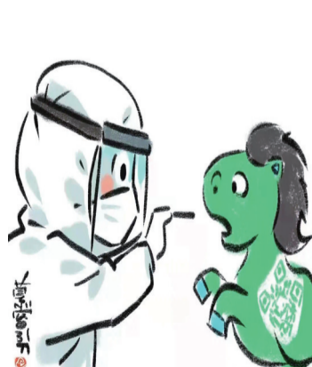
《守一方绿土 保八方平安》(漫画) 赵方群