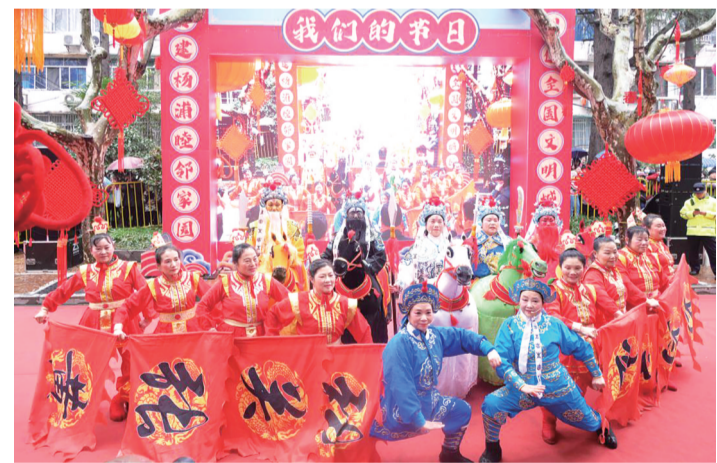
行街方阵由24支表演队伍近500人组成,从苏家屯路出发,上演武术、民族舞蹈等非遗成果,呈现“应接目不暇,惊叹神已驰”的文化意境。

年俗,历经千百年传承,承载着深厚的历史文化内涵,折射出人们对中华优秀传统文化深深的情感。四平路街道市级非遗项目“元宵行街会”自2005年开始举办至今,(下转第4版)